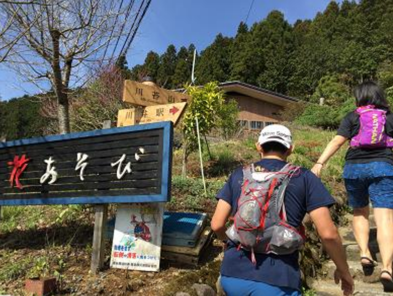
7. 花あそび向かいの「川苔山」道標より階段を登る。