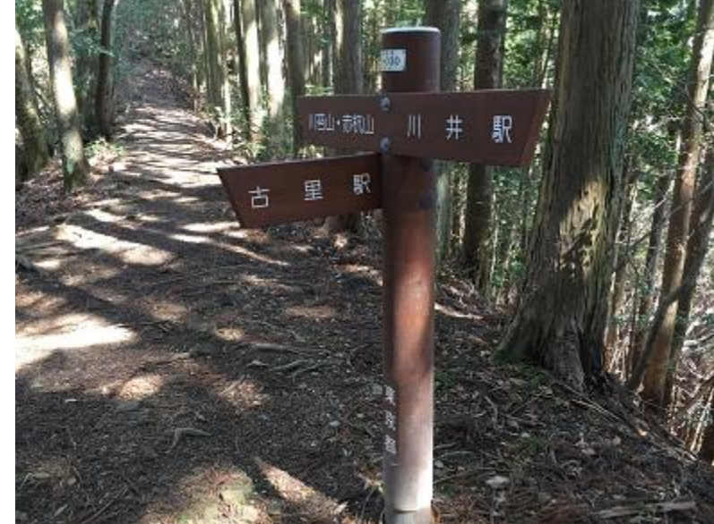
9. 一つ目の分岐。川苔山を目指す。