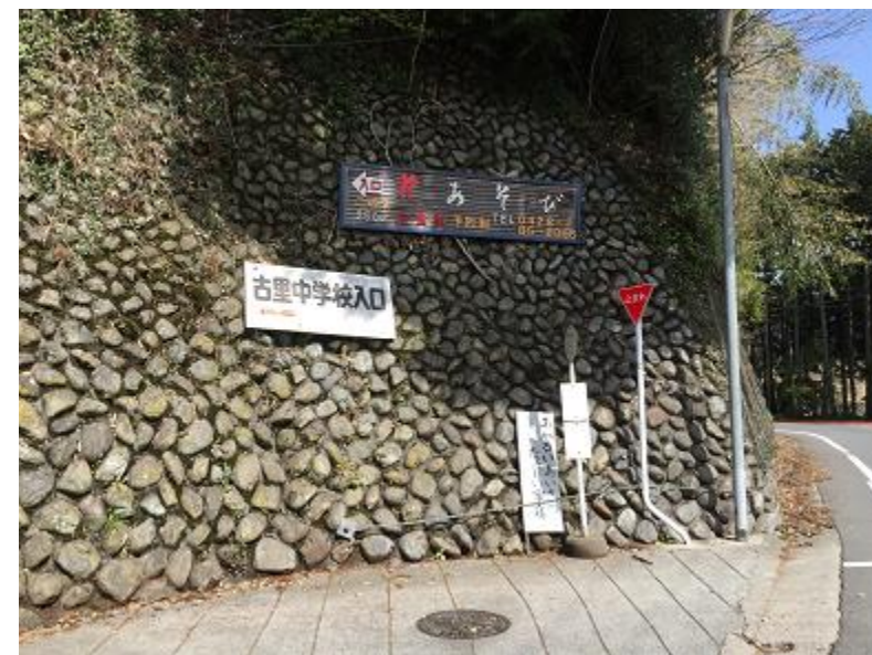
6. 「花あそび」「古里中学校」看板のある所を左折する。