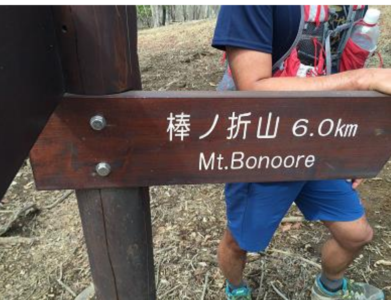
16. 日向沢の峰を越えた先の分岐。オオカミ、 ウサギは蕎麦粒山まで往復。カメは棒ノ折山へ。