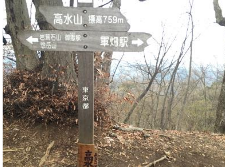
26. 高水山。★撮影ポイント★ (オオカミ選手のみ)