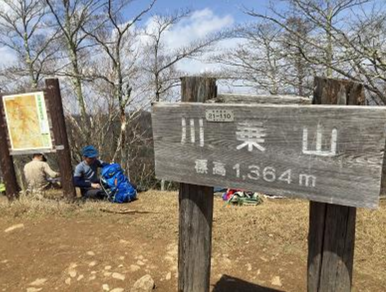
13. 川苔山。★撮影ポイント★ (オオカミ選手のみ)