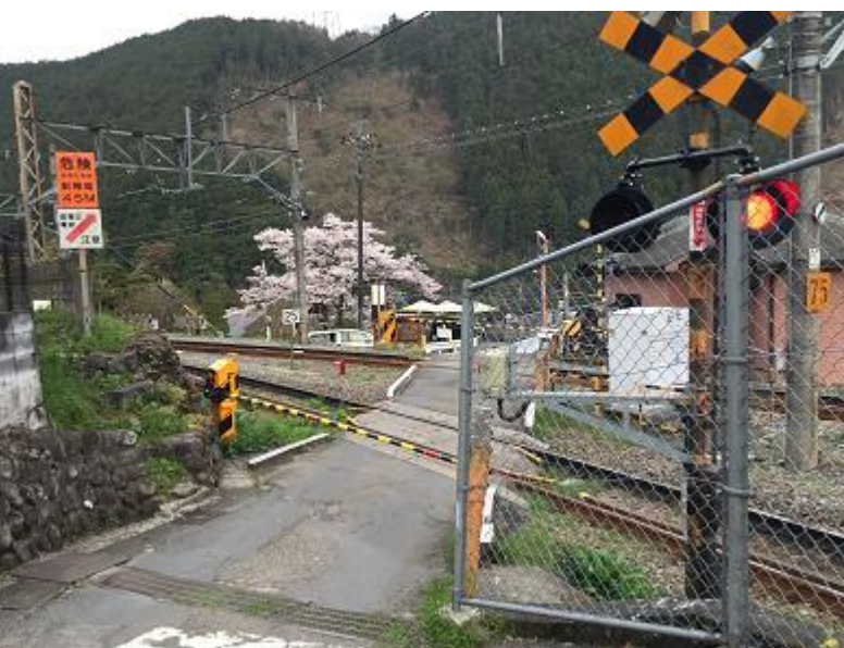
28. トレイルを下りきり線路の手前でゴールです。