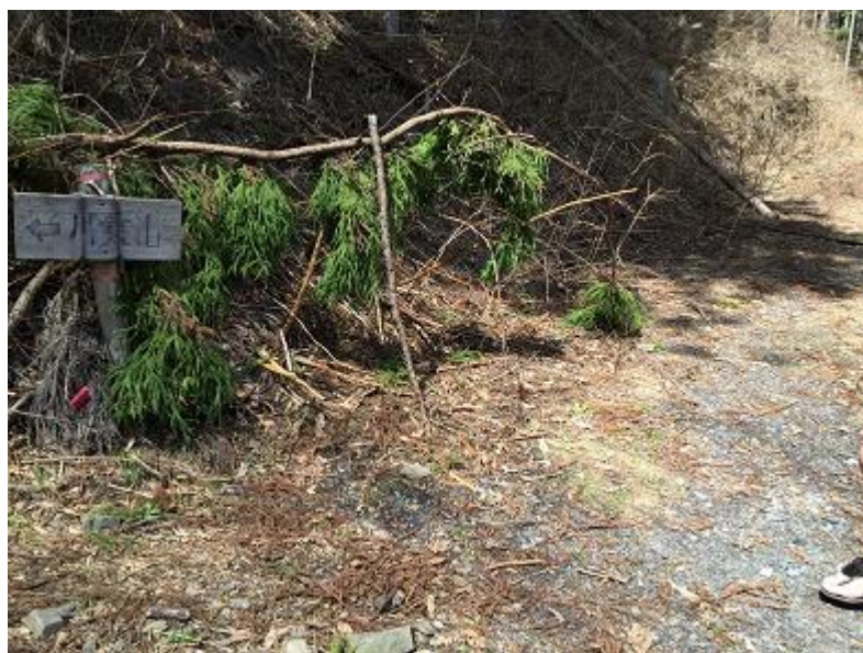
11. 「川苔山」の小さい看板。ここで作業道路を離れて再びトレイルへ。