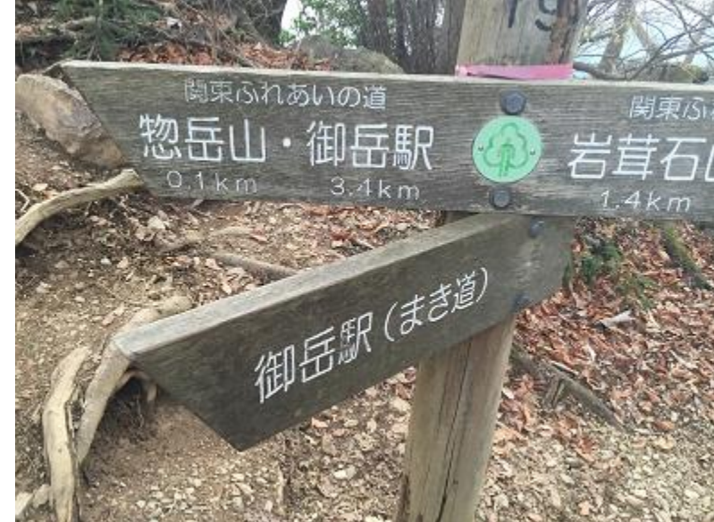
27. 惣岳山への分岐。 頂上、まき道どちらでもOKです。