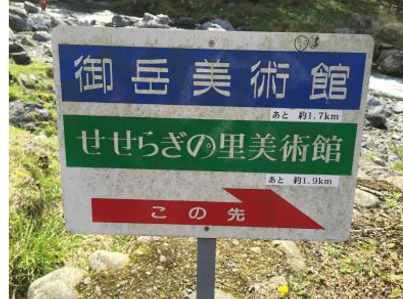
3. 御岳美術館を目指して多摩川沿いの遊歩道を進む。