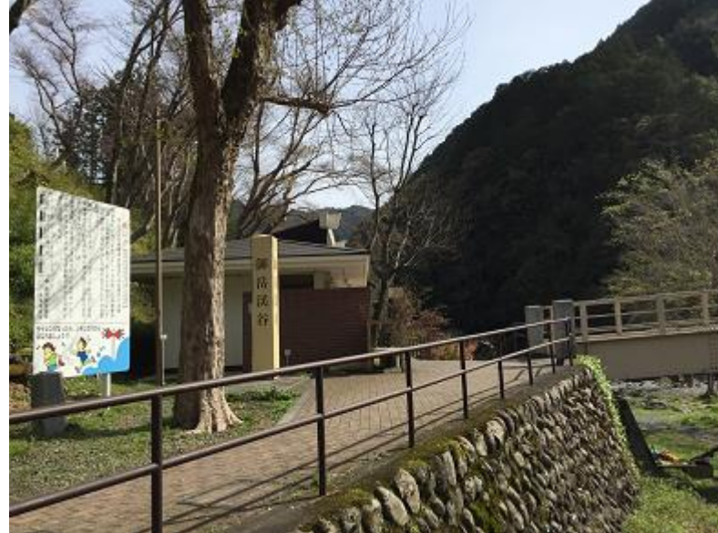
2. 降りたところの御岳小橋がスタート地点。