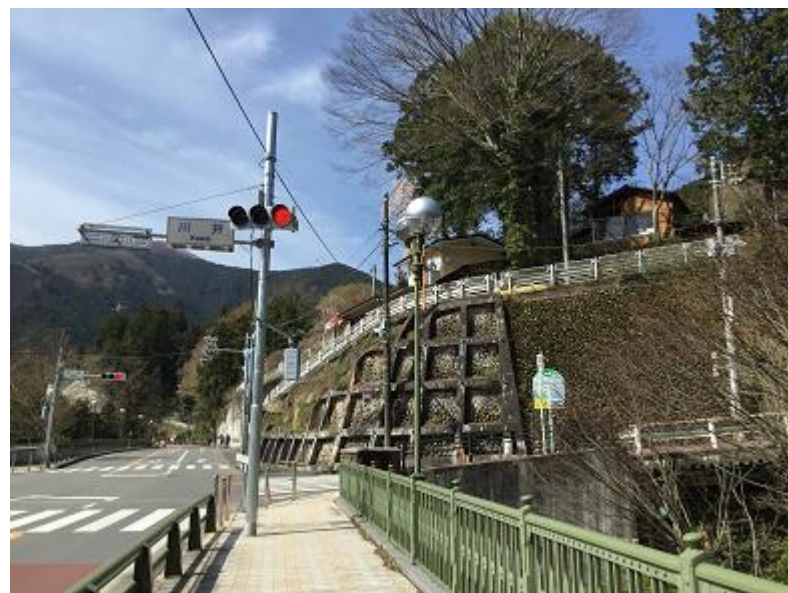
5. 「川井」交差点を右折し、ロードを登る。