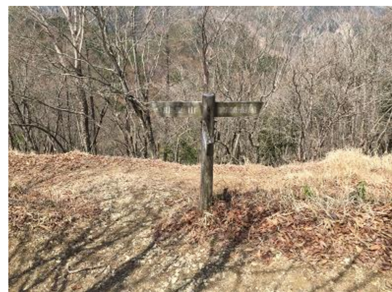
12. 曲ヶ谷北峰。オオカミ選手はここから川苔山を往復する。その他選手は蕎麦粒山へ。