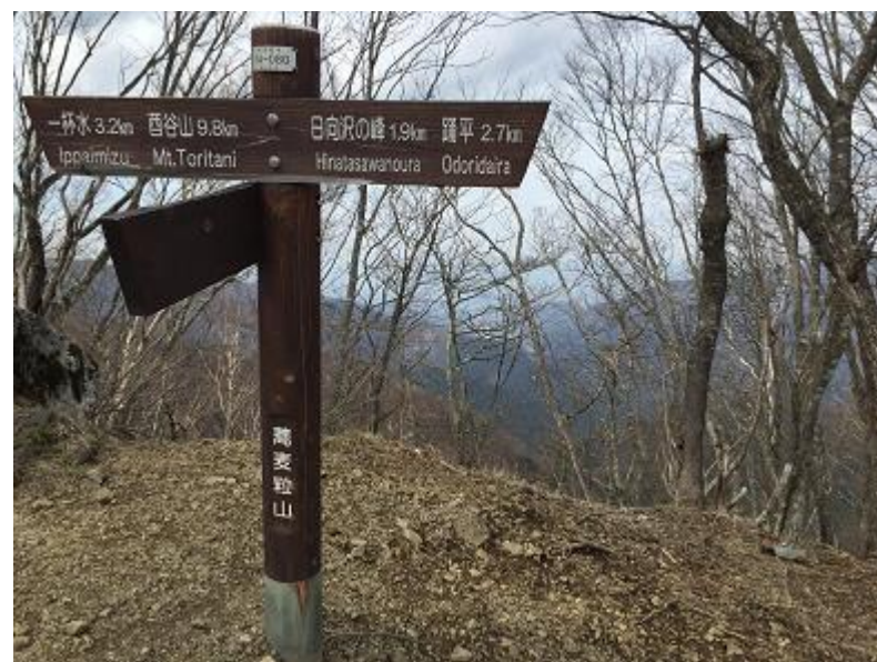
17. 蕎麦粒山。★撮影ポイント★ 日向沢の峰分岐まで戻ります (オオカミ、ウサギ)。