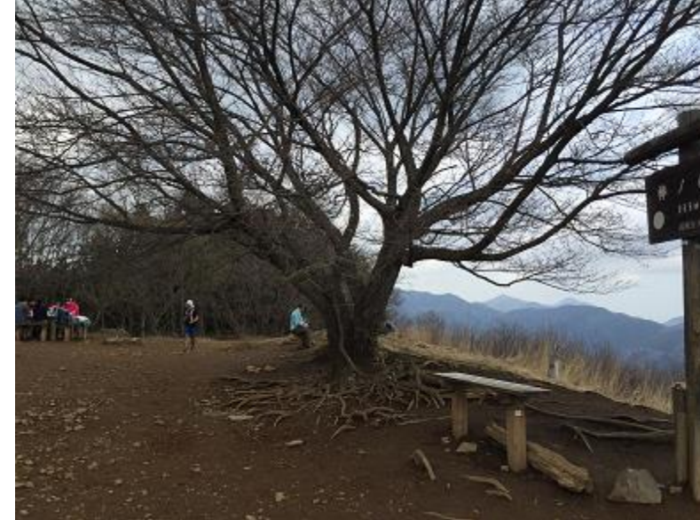
21. 棒ノ折山。エイドポイント。