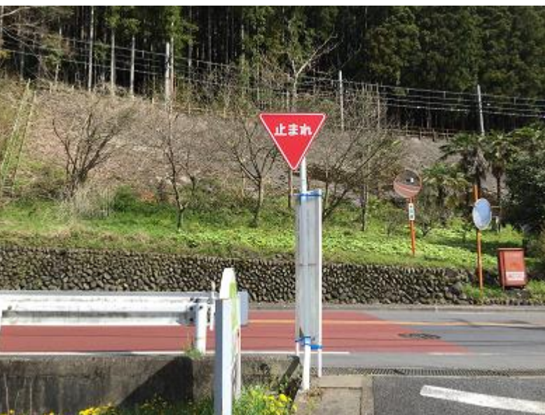
4. 御岳美術館よりロード道路を横断し、歩道を走って川井駅を目指す