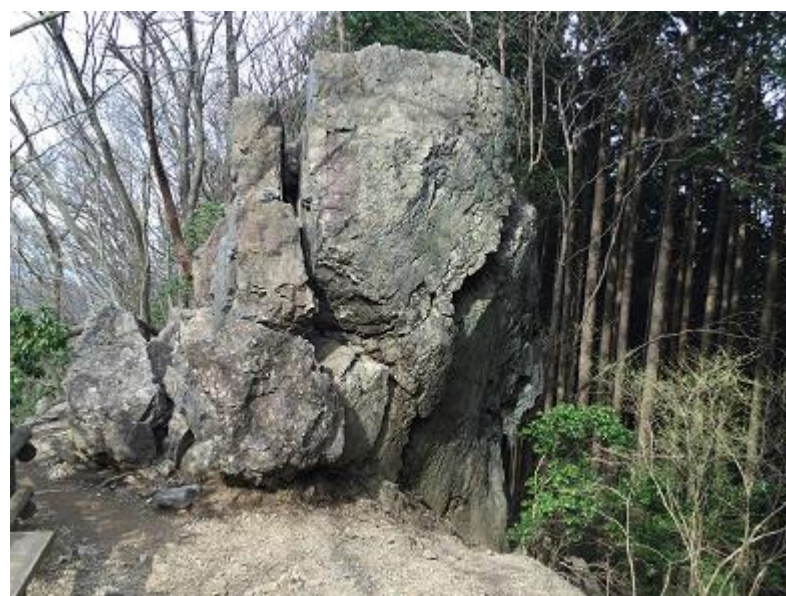
23. 岩茸石。★撮影ポイント★ (オオカミ選手のみ)