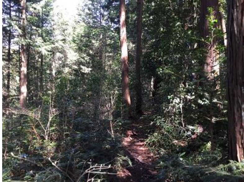
8. しばらくするとトレイルに入る。赤杭尾根。