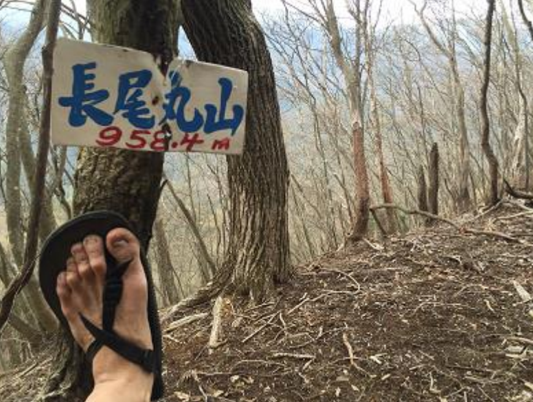
19. 長尾ノ丸。★撮影ポイント★ (全選手)