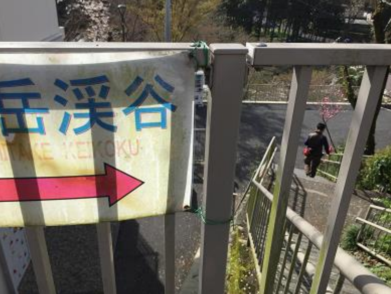
1. セブンイレブン横の階段を下りる。