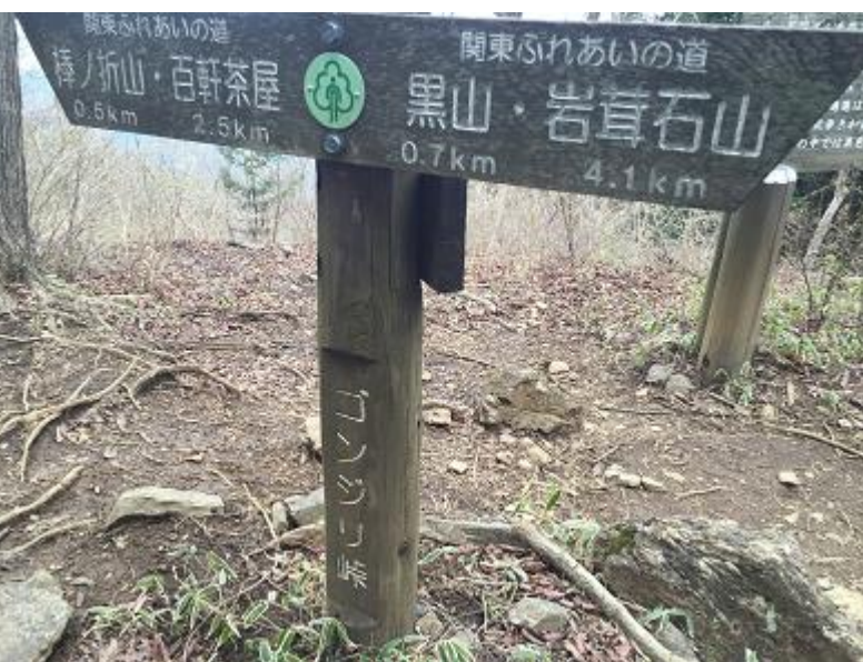
22. 権次入峠。オオカミはここより「岩茸石」を往復。他選手は黒山へ。