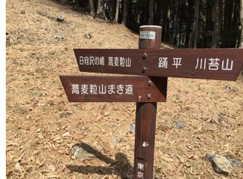
15. 踊平より5分ほど北に進んだ分岐。 「日向沢の峰 蕎麦粒山」へ登る。