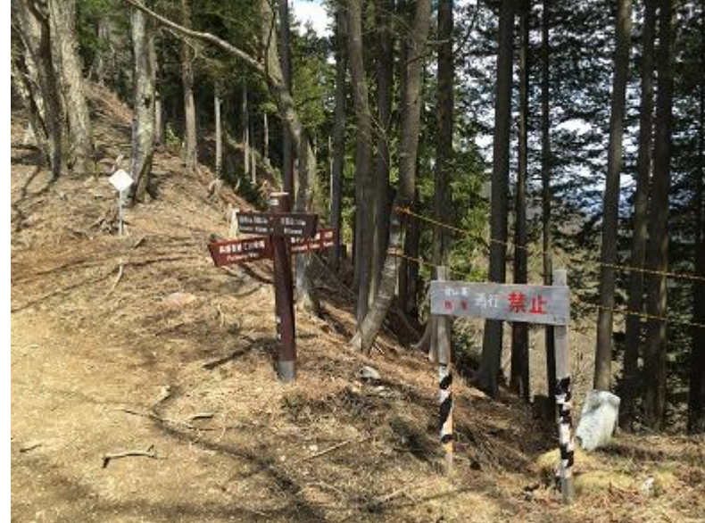
14. 踊平。蕎麦粒山方面へ。