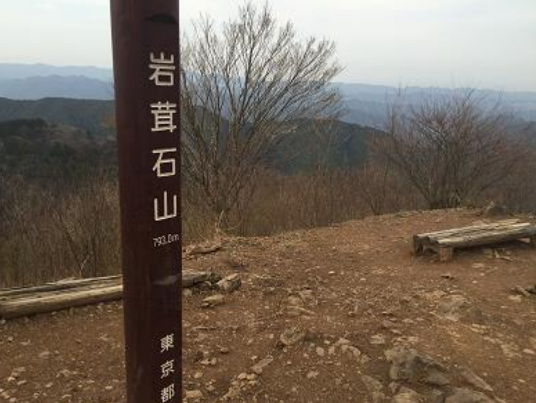
25. 岩茸石山。オオカミはここより高水山を往復。他選手は惣岳山